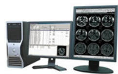
カンファレンスルーム