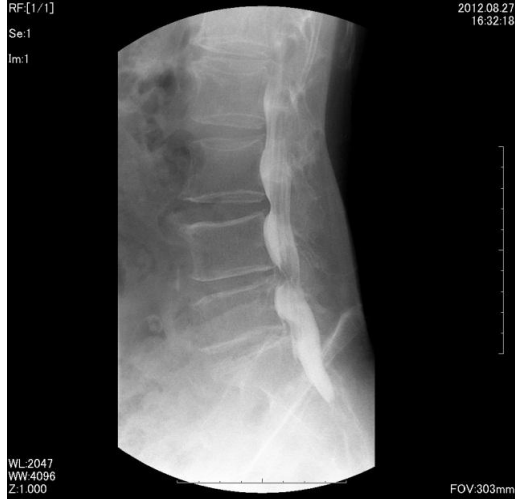
脊髄腔造影(ミエログラフィー)