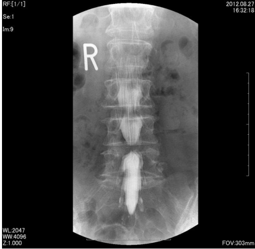
脊髄腔造影(ミエログラフィー)